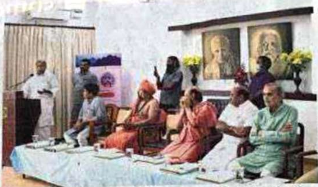
Chief Minister N. Rangasamy addresses a Siddha Day conference hosted by Sri Aurobindo Society recently.